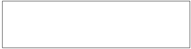
Личная подпись водителя

Примечание: подпись должна иметь четкие, хорошо различимые линии, ставиться черными чернилами, занимать 80% выделенной области и не выходить за пределы рамки.